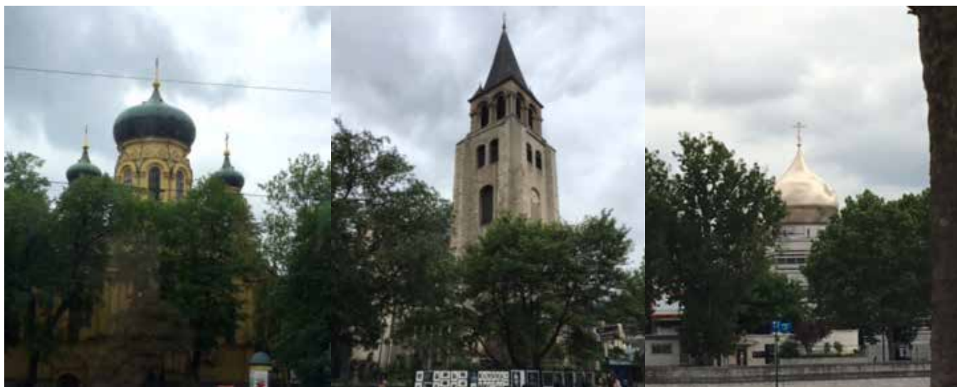
1. Главный православный храм Варшавы; 2. Церковь аббатства Святого Германа, Сен-Жермен-де-Пре; 3. Новый храм РПЦ недалеко от Эйфелевой Башни

объединённый концертный репертуар и смогли немного расслабиться за ужином, который прошёл за живой беседой, сдобренной бокалом вина.