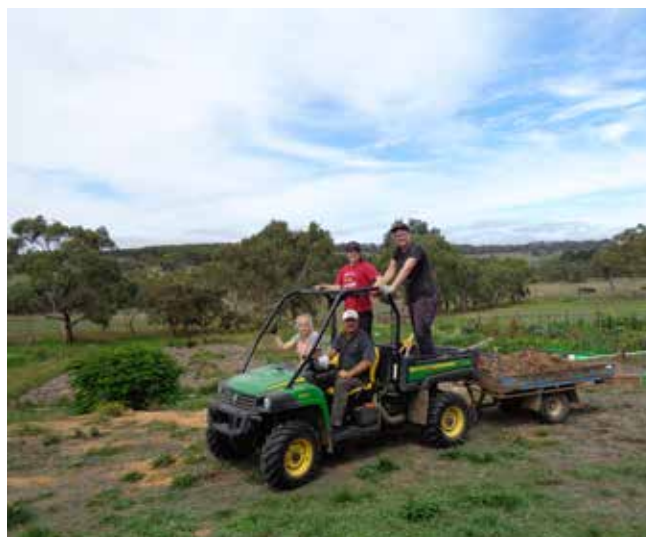
На предварительном субботнике

Первые сутки немного «штормило» – одна палатка даже порвалась от ветра (хорошо, что это случилось не ночью, а уже утром, когда все встали); но к вечеру воскресенья погода успокоилась, и после прохладной ночи с воскресенья на понедельник наступил чудный тёплый день. Было так хорошо, что многие хотели купаться, и если бы не надо было собирать лагерь и уезжать, то мы, наверное, искупались бы.