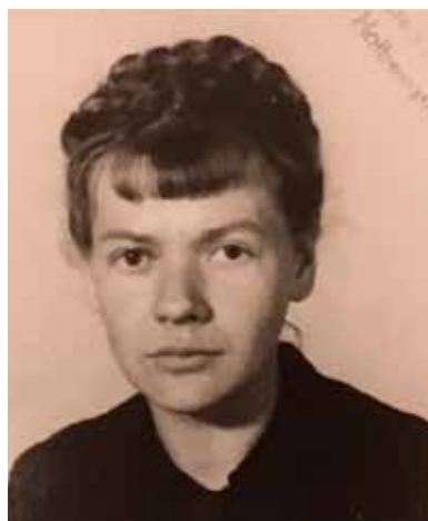
Отец и мать Наташи: