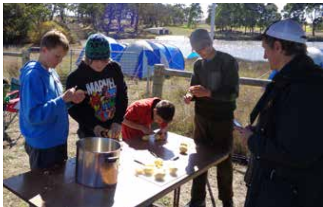
Соревнование по чистке картошки