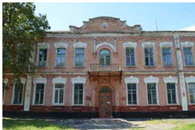
Школа в г. Хорол