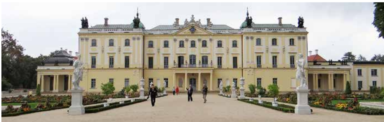
Дворец Браницких в Белостоке