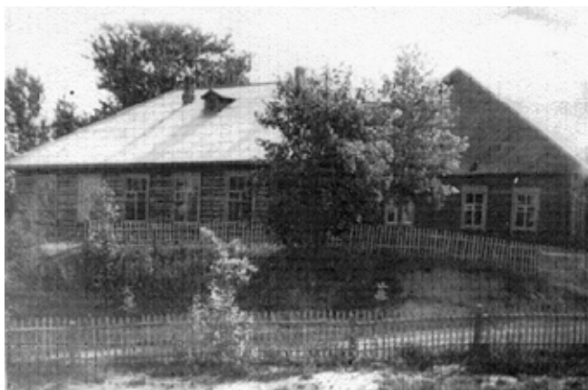
Гультяевская школа до войны