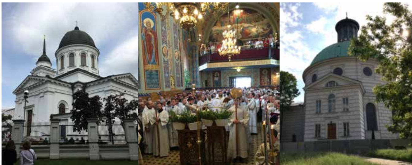
1. Св. Николаевский кафедральный собор в г. Белостоке; 2. Во время праздничной литургии в Св. Николаевском соборе Белостока; 3. Св. Троицкая Евангелическая церковь в Варшаве