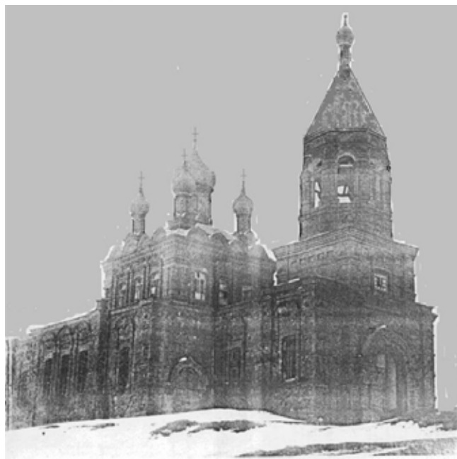
Храм Рождества Иоанна Предтечи в с. Гультяи

в Германию. Кто знает, как сложилась бы его судьба в родном краю? Многие деревни Пустошкинского района вместе с местными жителями были сожжены фашистами. От 245 деревень района осталось только 39. Довоенное число жителей района до сих пор не восполнилось. На местах сожжённых деревень всё заросло травой, и только по одному не сгоревшему дубу сохранилось на месте каждой деревни. Как пишет современный краевед Сергей Зарембо: «...Так остались одни названия и дубы, что до сих пор стоят, по одному в каждой бывшей деревне».